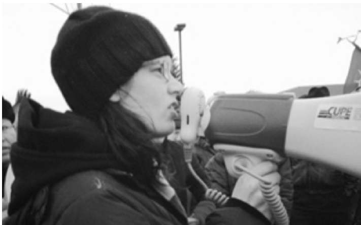
Simpson hablando en la protesta de Idle No More en Peterborough, Ontario.

Leanne: incluso en un centro comercial. Y, ¿qué tan escandalizador es eso?