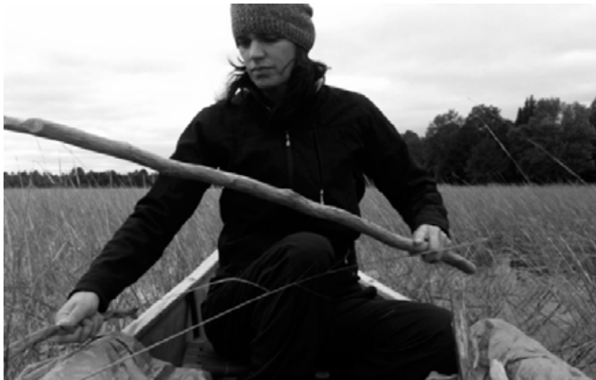
Leanne Simpson recolectando arroz silvestre.